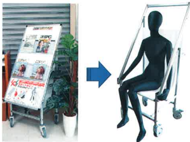
「サポートサイン」（常磐精工株式会社） 緊急時には看板から車いすに早変わり。