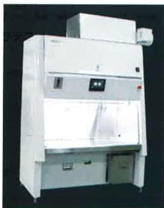
「MEDIO 3」（株式会社タムラテコ） 抗がん剤をオゾンで除染失活化を可能とした世界初の安全キャビネット。